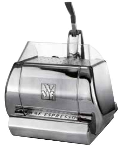
1955 Favoriet van barista's

Vroeger kon niet iedereen een barista worden. Tijden veranderen.