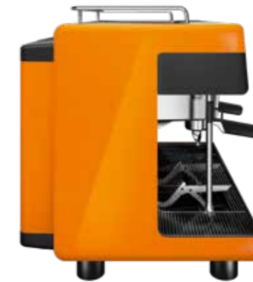
Gloss Burnt Orange