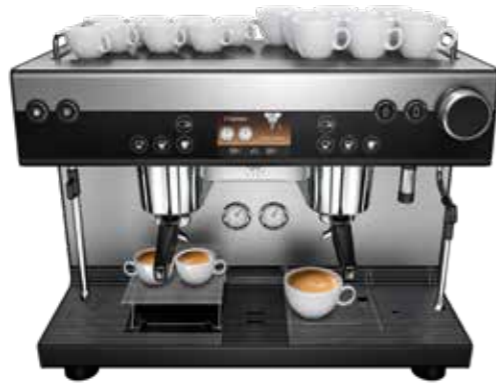
2015 Geliefd bij iedereen