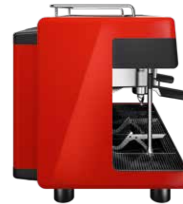
Gloss Dragon Fire Red