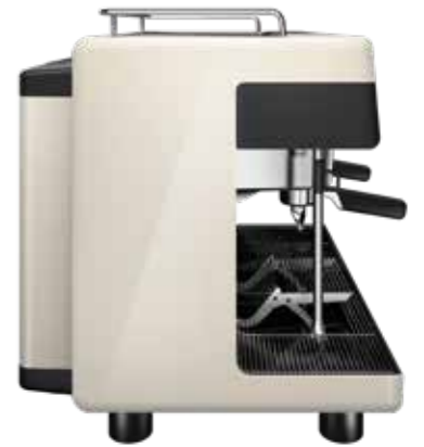
Satin Pearl White